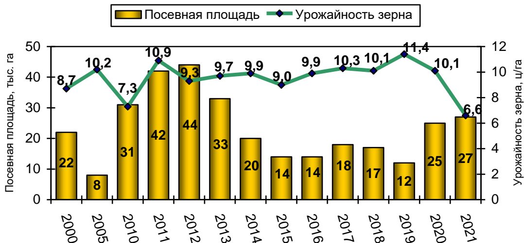
Рисунок 1 – Посевная площадь и урожайность зерна гречихи в Беларуси, тыс. га, ц/га

Это связано с высокой зависимостью гречихи от климатических и погодных условий на протяжении всей вегетации, особенно в период плодообразования, с морфотипом сорта и его реакцией на условия среды и агротехнику выращивания. В то же время проблему обеспечения Беларуси гречневой крупой можно решить, существенно увеличив посевные площади, урожайность и валовый сбор зерна гречихи в республике.